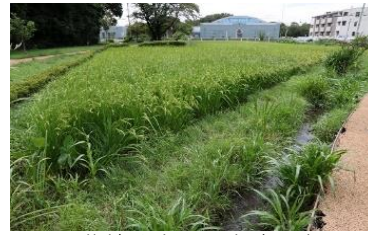
No52, 柴崎分水廻り水路と水田