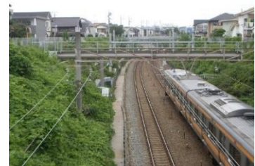
No50, 柴崎分水の中央線掛樋