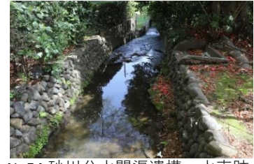
No54, 砂川分水開渠遺構・水車跡