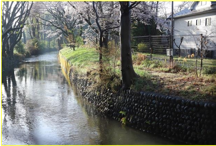
No10, 古残堀川交差付近の大曲

「市民が選んだ玉川上水・分水網関連遺構100選」で、立川市は、「10, 古残堀川交差付近の大曲」他11か所が選定されました。これを機会に、立川市に江戸時代から現在に残る遺構を、立川市のお宝「玉川上水・分水網関連遺構」として、市民の皆さんに、講演と展示で紹介いたします。